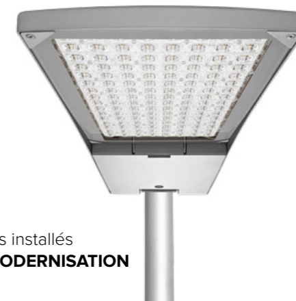
Luminaires installés APRÈS MODERNISATION

Lampe à sodium 168 W - 161 pièces Lampe à sodium 279 W - 13 pièces