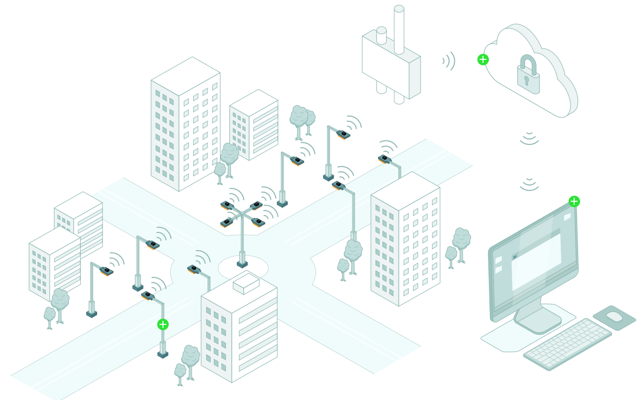
Schéma de fonctionnement du système CLUE CITY. Communication bidirectionnelle et gestion de l'éclairage.