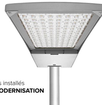
Luminaires installés APRÈS MODERNISATION

Lampe à sodium 168 W - 161 pièces Lampe à sodium 279 W - 13 pièces